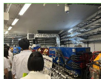
ニュースバル見学の様子