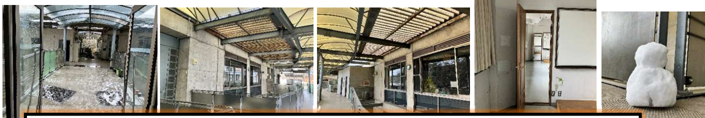
ほぼ外じゃない!という特別な教室棟。中扉で隣とつながる面白教室。1年間ありがとう。さようなら。

1つ、今後さらなる成長を期待することがあるとすれば、『『自由』は場に応じた振る舞いが前提にあった上でのものである』ということ、より理解し行動できるようになってほしいということです。2年生は学校の中心となる学年です。1年生の先輩として、学校を盛り上げる中心学年として是非力を発揮してほしいと思います。可能性は∞!