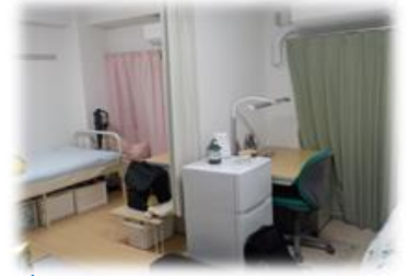
↑中学生は2人部屋・エアコン完備

令和4年度から、平日の通学緩和のため、 中学生も寄宿舎で生活できるようになりました。 県下各地の友人・先輩とともに切磋琢磨しながら、 自立への第一歩を踏み出しましょう！