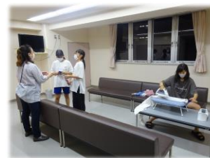
↓支援員さんとアイロンがけ