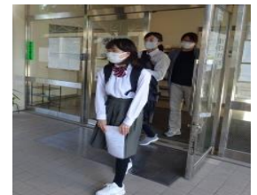
↑朝、支援員さんの送り出し