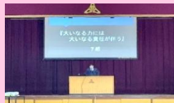
学年スピーチ大会