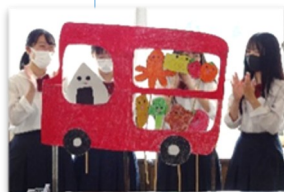
授業内発表 (保育実践)

国語読解・国語探究・実用国語表現・総合英語Ⅱ・総合英語Ⅲ・英語探究・応用数学・世界史研究・日本史研究・科学探究・生物基礎探究・素描・ソルフェージュ・コミュニケーションA・尼崎学