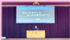
学年スピーチ大会