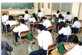
授業 (ICT 機器活用)

早朝・放課後の補習、長期休業中の補習、週末課題、小テストの実施、英語検定、漢字検定等の対策指導を実施しています。また授業では ICT 機器を積極的に活用します。