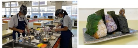
「あいおいタやけ食堂」