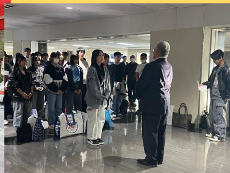
○解団式(大阪空港にて)