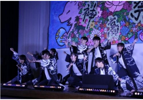
オープニング(生徒会)

合唱コンクールでは、各クラスが練習の成果を披露してくれました。優勝は、二年一組でした。六月中旬とは思えないほどの気温の上昇でしたが、暑さに負けず頑張っていました。