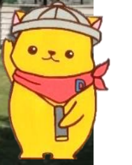
マスコットキャラクター 「カン太くん」