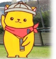
マスコットキャラクター 「カン太くん」