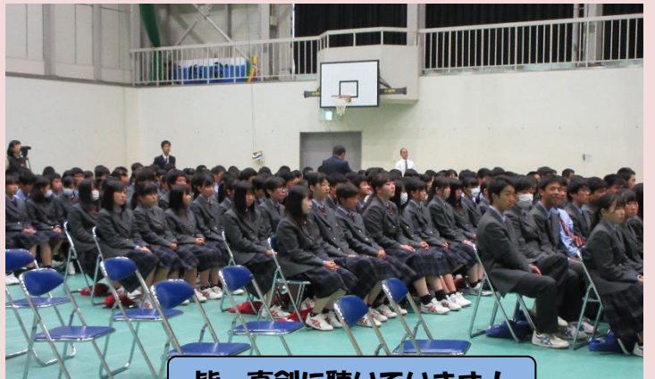
皆、真剣に聴いています！