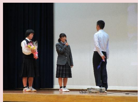
講演の感謝の気持ちを述べてくれました！