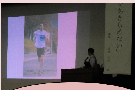
諦めないこと、挑戦する 大切さを学びました。