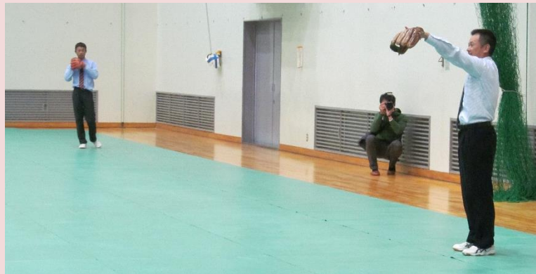
野球の技術を披露していただきました！