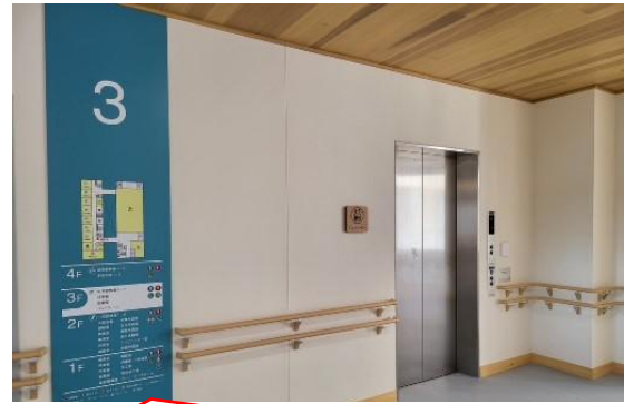
エレベーターホール。各階に表示があります。