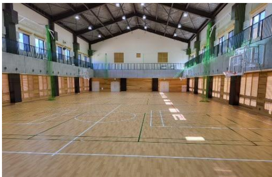
体育館。正面から後方を見たところです。