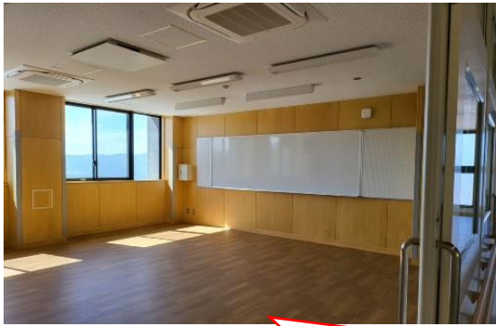
普通教室です。小中高とも前面はほぼ同じ。