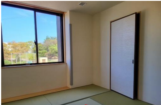
生活学習室。お風呂や洗面所などもあります。