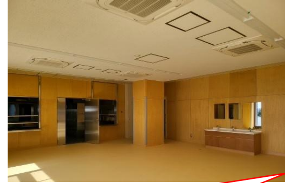
ランチルーム。この右手がカフェスペースです。