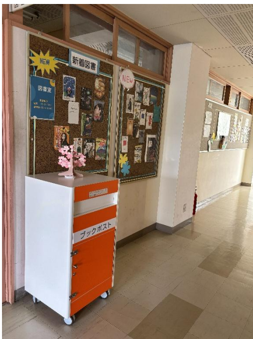
返却しやすいようにブックポストもあるよ