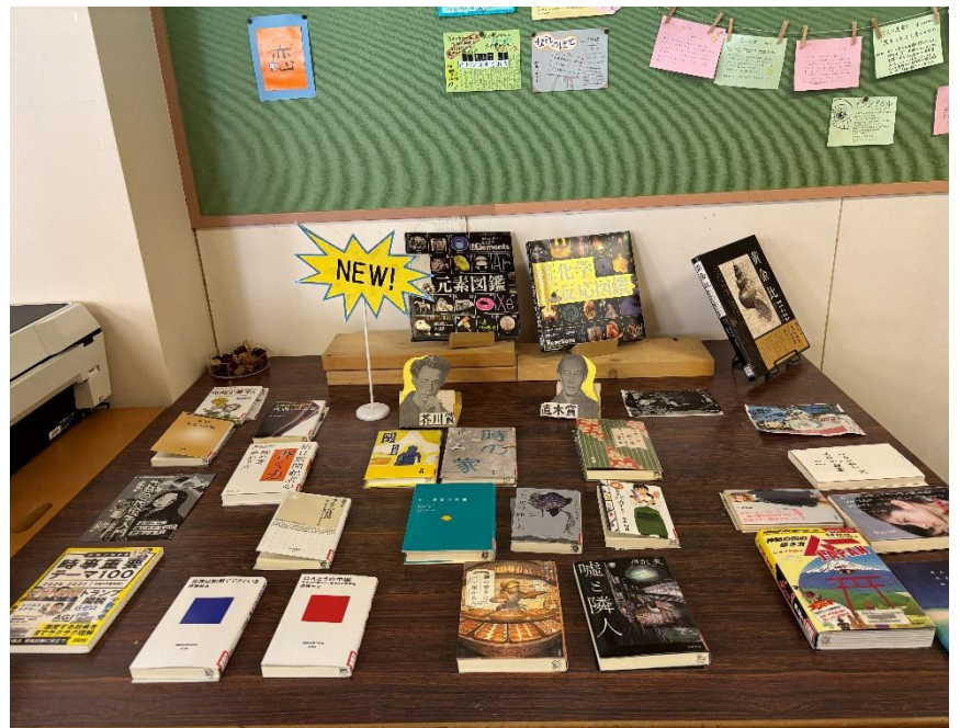
人気の新刊コーナーです