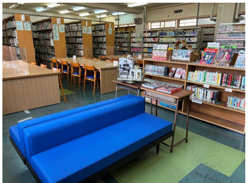
たくさんの蔵書が整理して並べられています。先生からの寄贈本コーナーもあるよ。