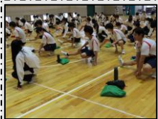
準備運動は入念に!

当日は天候にも恵まれ、男子6Km(コース3周)・女子4Km(コース2周)を生徒たちはそれぞれのペースで一息懸命走り切る姿をみせてくれました。ゴールした後の表情はとても印象的で、最後まであきらめない気持ちや応援での仲間とのつながりを感じられる一日になったのではないのでしょうか。