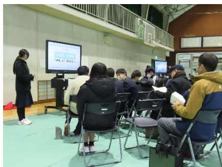
ゆめいくプロジェクト発表