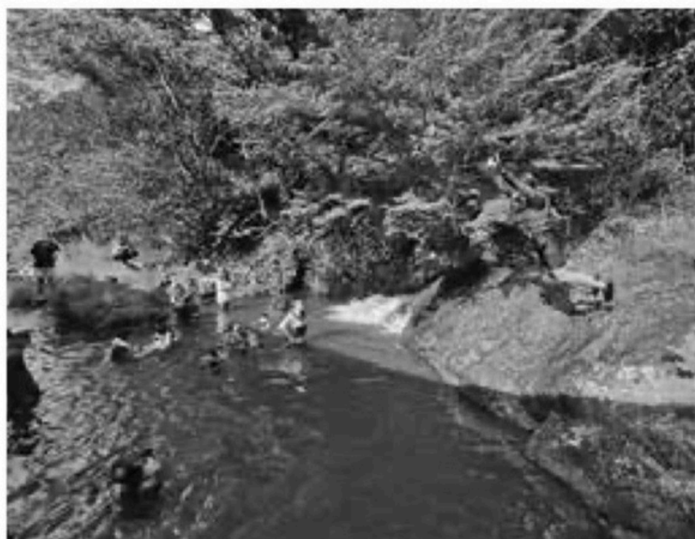
▲与布土自治協の自然体験活動

もたちを対象とした環境体験事業に取り組んでいる。それらの活動では、小学生の時に活動に参加していた中学生、高校生が活動の運営の手伝いをしているという所もある。環境体験活動は若い方の参画の場になっている。また、地域自治協議会からは、子どもたちが活動に参加することにより自治協議会の認知度が上がったなどの声もある。市としても引き続き自治協議会と連携しながら地域の環境体験活動を進めていく。