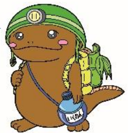
生野高校 マスコット「いくのん」