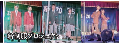
新制服プロジェクト