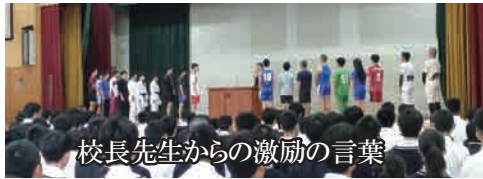
校長先生からの激励の言葉