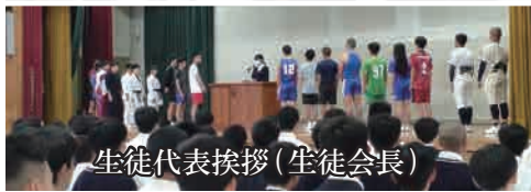
生徒代表挨拶 (生徒会長)