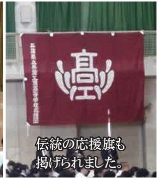
伝統の応援旗も掲げられました。