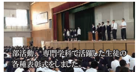
部活動、専門学科で活躍した生徒の各種表彰式をしました。