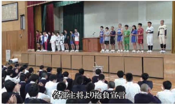
各部主将より抱負宣言