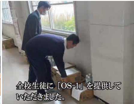
全校生徒に「OS-1」を提供していただきました。