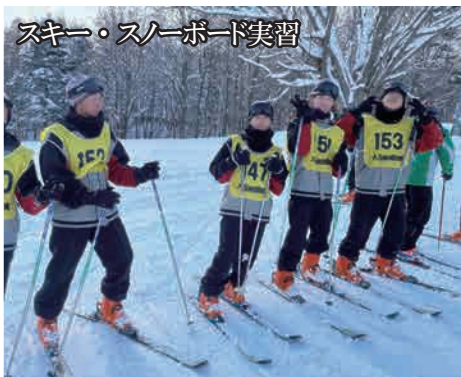
スキー・スノーボード実習