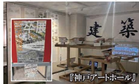
『神戸アートホール』