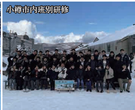
小樽市内班別研修