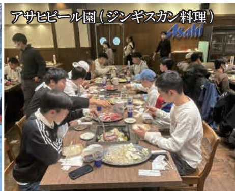
アサヒビール園 (ジンギスカン料理)