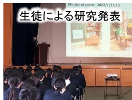
生徒による研究発表