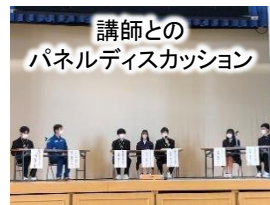
講師との パネルディスカッション