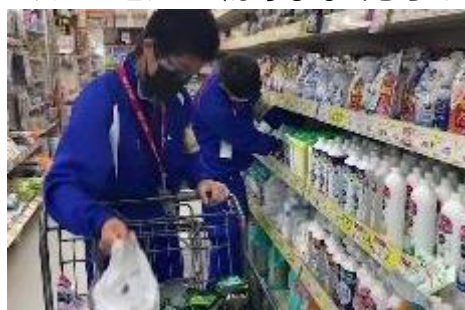
品出しの様子 〈ホームプラザナフコ〉