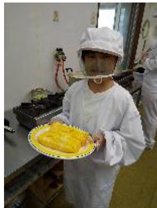
お弁当づくり 〈はりまふくろうの家〉