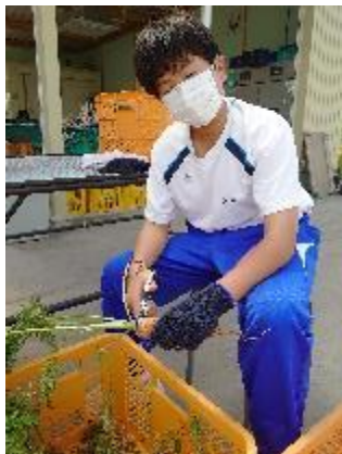
人参の袋詰め 〈ラーフウッド〉