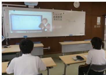
【シャープ特選工業出前授業】