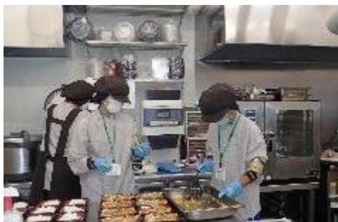
お惣菜づくり 〈マックスバリュ宮西店〉