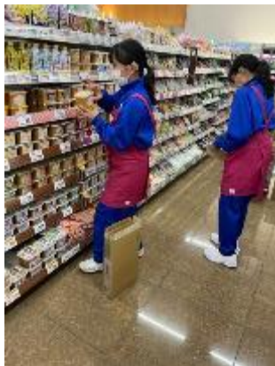
品出しの様子 〈マックスバリュ城の西店〉