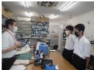
ホームプラザナフコ