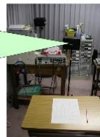
単音・単語の聞き取り検査