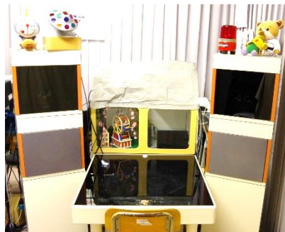
補聴器や人工内耳を装着して聴力を測る