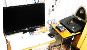
語音検査(ごんけんさ)