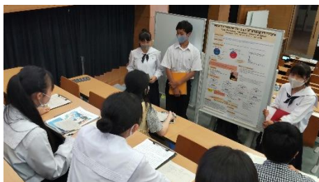
発表をしている様子