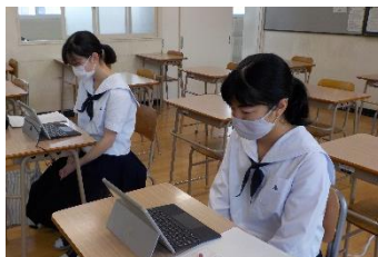
キックオフイベントの様子

コンテストでは、台湾の高校生2名、オーストラリアの高校生2名を加えた計6名のチームで活動します。約2か月間で、ビッグデータを活用し、データに基づく日本国内の旅行ビジネスプランを作成します。同年代の外国の生徒と、1つの課題に協力して取り組むことは、貴重な経験になるでしょう。結果だけでなく、過程もしっかり楽しんでほしいと思います! 頑張り!