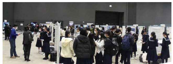
(生徒ポスター発表の様子)

12:45~15:45までポスター発表を行いました。同時並行で大学・企業の研究紹介を展示する「大学・企業ブース」、大学院生や大学生と自由に話せる「サイエンスカフェ」も同会場内で行いました。