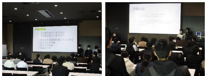
(会議室 403 での口頭発表の様子)