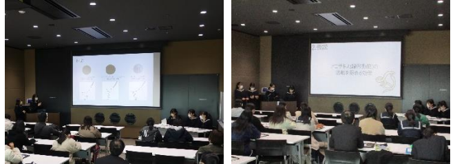
(会議室 402 での口頭発表の様子)