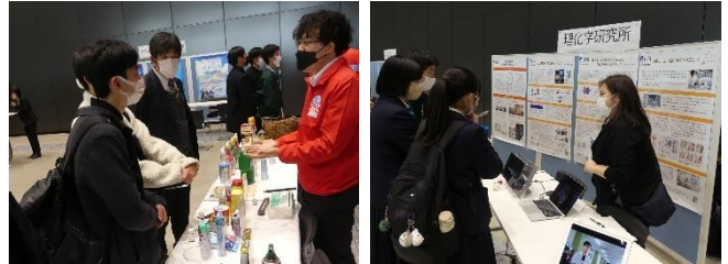
(大学・企業ブース展示の様子)