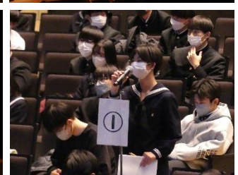
(生徒口頭発表の様子)