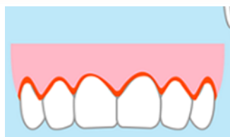
は はぐき 歯と歯茎のさかいめ