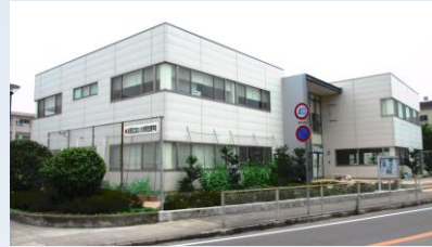
別館棟(地域連携交流施設)