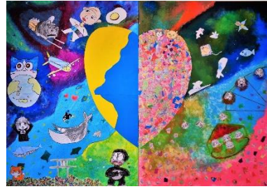
(令和4年度 本校美術部と播磨南高校とのコラボアート作品)