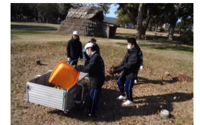
考古博物館の清掃