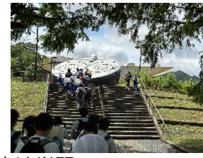
宿泊学習(西脇市テラドーム)