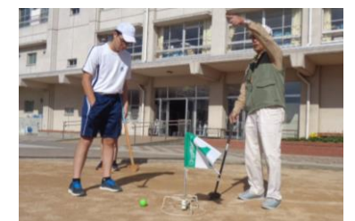
シニアクラブとの交流