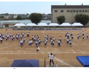
スポーツフェスタ学部演技