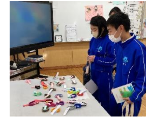
作業学習フェスタ