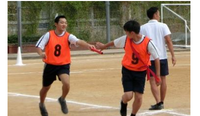
スポーツフェスタ