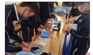
東はりまフェスタ(販売)