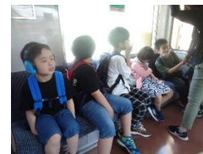
体験学習(山陽電車)