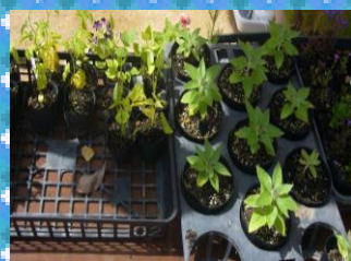
元気な苗も売っています♪