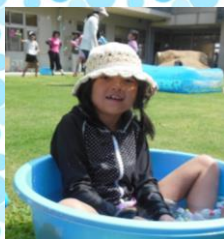
とってもいい笑顔(^^)

今年も天気に恵まれ、たくさんの子供達が参加してくれました。それぞれのお気に入りを見つけ、気持ち良さそうに水遊びを楽しんでいました。親同士やきょうだいの交流も持て、楽しい一日になりました。お手伝い頂いた先生方や保護者の皆さん、ご協力ありがとうございました。