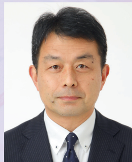
兵庫県立東播磨高等学校 学校長