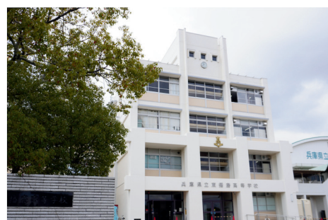
各種校舎外壁塗装