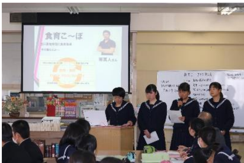
6班 食育～スポーツをする上で丈夫な体をつくるには～