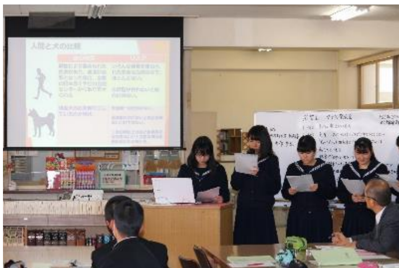
4班 動物の輸血の現状