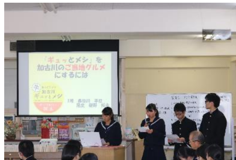
1班 「ギュッとメシ」を加古川のご当地グルメにするには