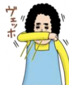
咳エチケット 忘れんといてや