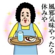
風邪気味や 休みや