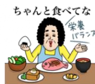
ちゃんと食べてな 栄養バランス