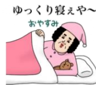
ゆっくり寝えや おやすみ