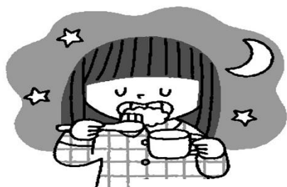
みがくタイミング