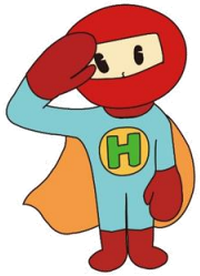
本校マスコットキャラクター はんとくマン!!