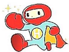
本校マスコット はんとくマン