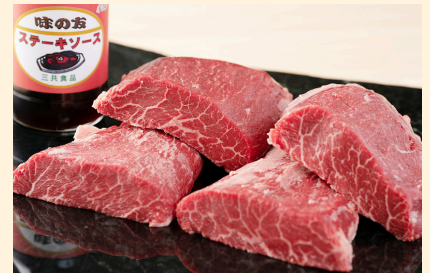
F1 宍粟牛ももステーキ(315g)と ステーキソースのセット