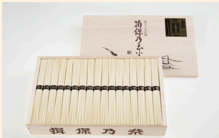
AA4 揖保乃糸 特級品2.4kg