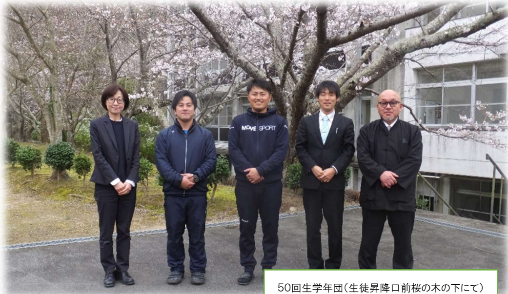
50回生学年団(生徒昇降口前桜の木の下にて)

この学年通信は、年間10号程度の発行予定です。保護者の皆様や50回生の皆さんに行事予定やお伝えしたいことを掲載します。第1号は学年団の自己紹介です。少しでも私たちのことを知って頂けたらと思います。是非目を通してください。(窪前)