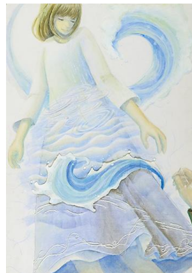
高等学校の部/優秀賞 作品名:「流れる水は」 読んだ本:「水を縫う」(集英社)