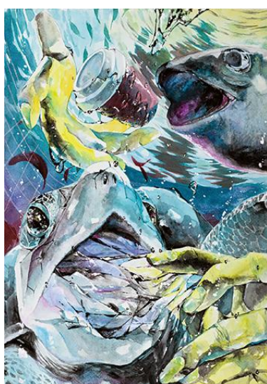
高等学校の部/優秀賞 作品名:「行動」 読んだ本:「レッドリスト・プラネット 野生生物を守り、地球を救うために」 (評論社)