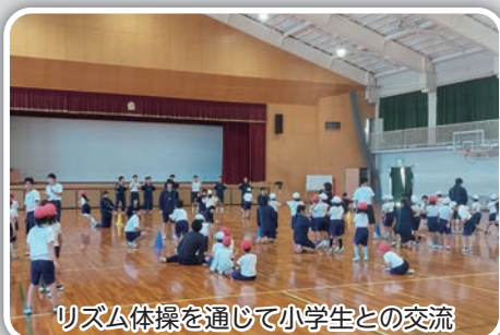
リズム体操を通じて小学生との交流