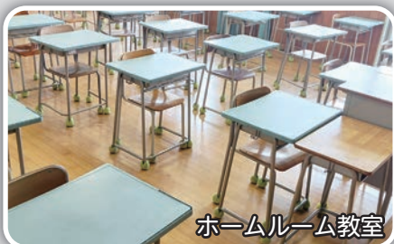
ホームルーム教室