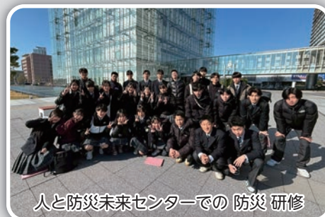
人と防災未来センターでの防災研修