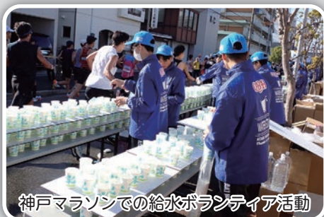
神戸マラソンでの給水ボランティア活動