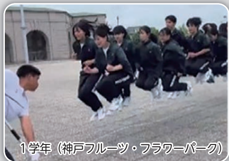
1学年 (神戸フルーツ・フラワーパーク)