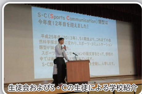
生徒会およびS・Cの生徒による学校紹介