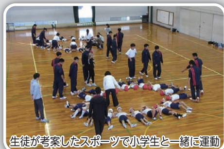
生徒が考案したスポーツで小学生と一緒に運動

トップアスリートやスポーツ分野の専門家による指導や講演会、特色ある授業など、人間力、コミュニケーション能力を向上させるプログラムを設置しています。専門科目としてスポーツ総合演習や学校設定科目としてスポーツ科学、スポーツ・コミュニケーションなどの科目を設けており、特色のある指導を行っています。