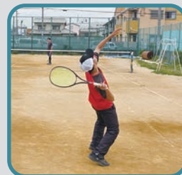
男子ソフトテニス部