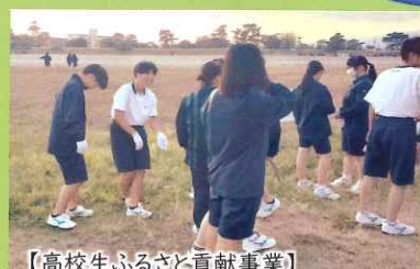
【高校生ふるさと貢献事業】