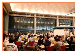
クラスレクリエーションの時間 予定した時間を超えるくらい 各クラスのレクが盛り上がった