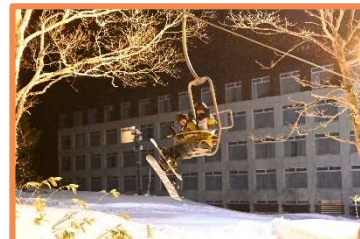
ナイトスキーは貸し切り 存分に滑れて満足