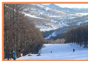
スキー実習に参加できなかった生徒も 別メニューで志賀高原の景色を楽しみました