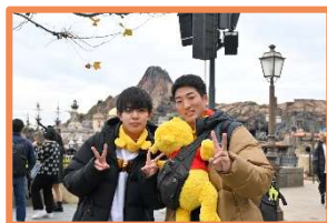
ディズニーシーは昼まで観光。 すべてを周るには短すぎる!