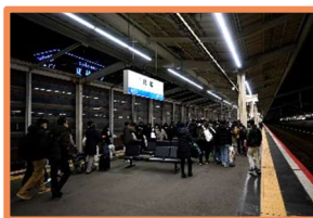
無事に姫路に到着。家に帰るまでが修学旅行