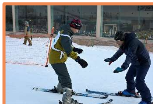
インストラクターの指導 ハの字でゆっくり