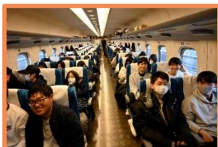
行きの新幹線から ワクワクが止まらない