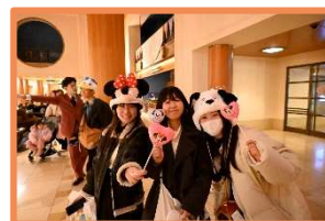
ディズニーランドは昼から夜まで観光。アトラクションやパレード、ご飯も食べて大満足 ホテルに無事たどり着いて安心