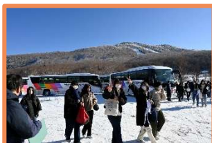
到着! 最高の天気 思わずピース