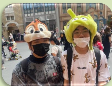
東京ディズニーランド