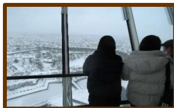
星型も夜景もきれいだねー