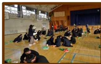
百人一首大会開幕!