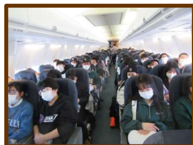
よく学びよく遊び、そして疲れた...