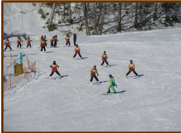
スキーも最高!! スノボも最高!!