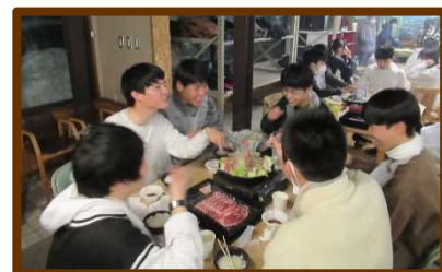
北海道のご飯おいしいな~♪