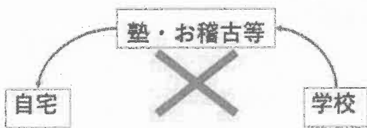
迂回経路は認められません

通学目的ではない定期券について補助金を申請するなど、本補助金の申請に関して偽り、不正等が判明した場合は、交付した補助金全額を返還していただきます。また、その後の補助金の申請を受け付けません。