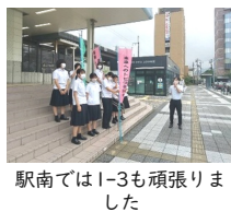
駅南では1-3も頑張りました