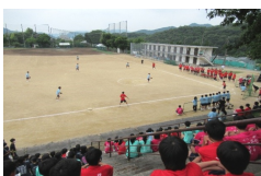
ソフトボール決勝戦