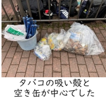
タバコの吸殻と空き缶が中心でした