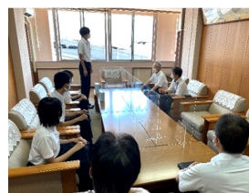
川邊前会長による経緯の説明