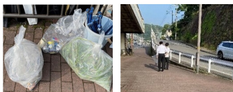
生徒会による駅周辺のごみ拾い

駅前では生徒会と1年2組の半分が、さわやか挨拶運動を実施しました。生徒会メンバーは、いつも通り早く来た生徒から、駅周辺の