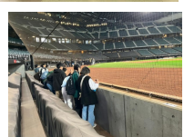
エスコンフィールドコース