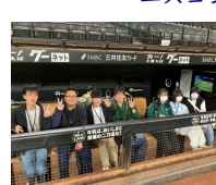
エスコンフィールド