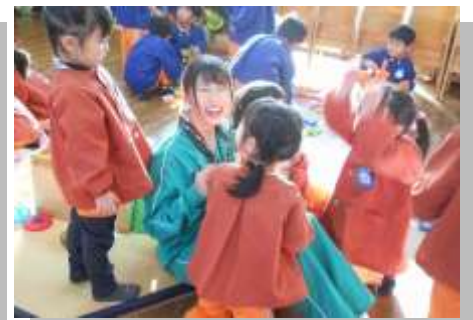
3年選択教科「子どもの発達と保育」