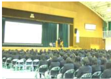
健康教育講演会～危険ドラッグの恐ろしさ～