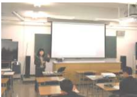
高大連携特別講義