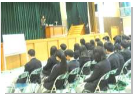
心のサポート講演会