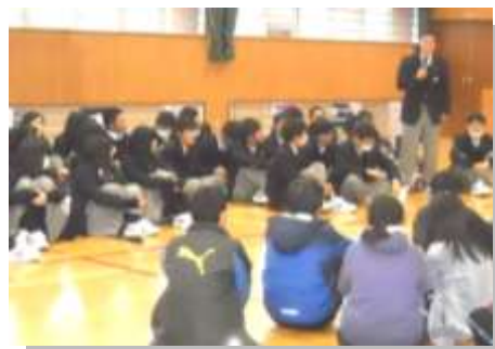
網干小学校への英語指導