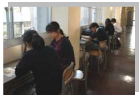
進路シーズン:職員室前自習風景