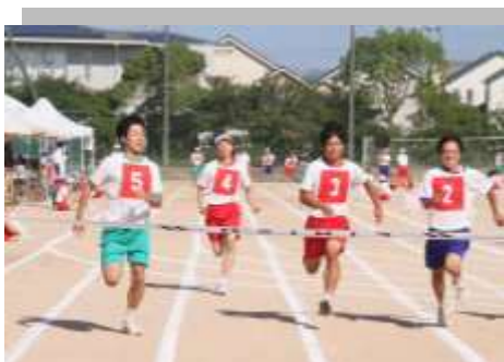
第 39 回体育大会