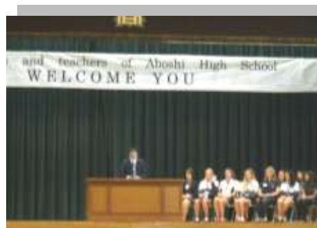
西豪交換留学団 来校