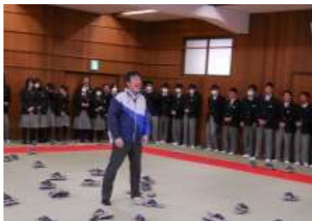
センター入試激励会(3年)