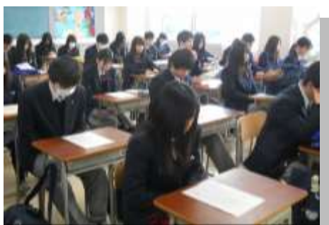
阪神・淡路大震災 追悼行事